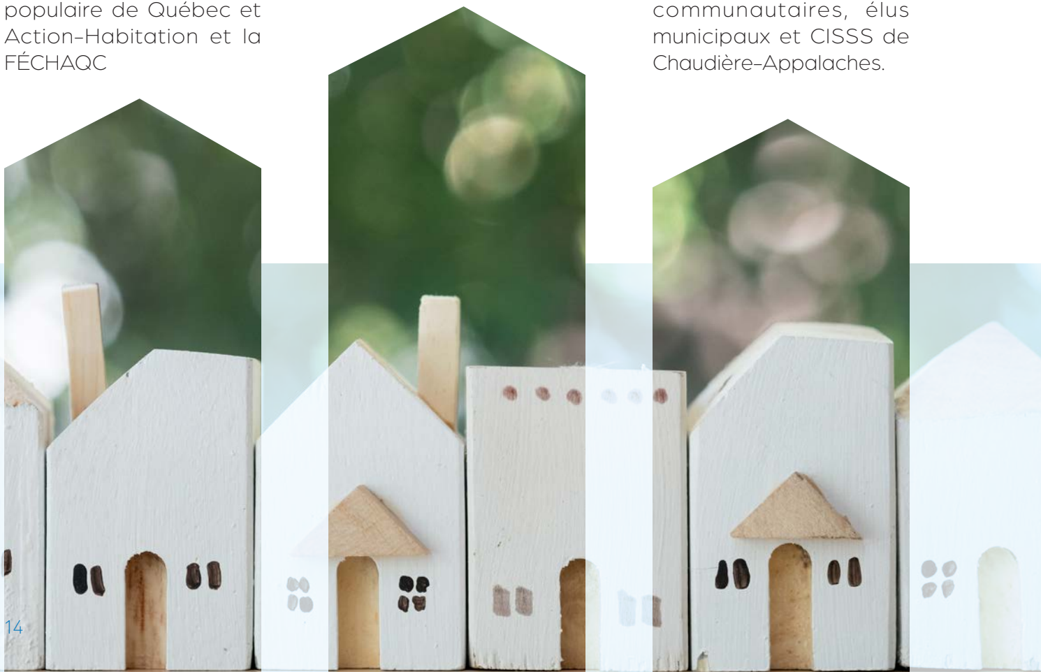
Table de concertation Beauce-Sartigan qui regroupe une dizaine d'acteurs du milieu de l'habitation : organismes communautaires, élus municipaux et CISSS de Chaudière-Appalaches.