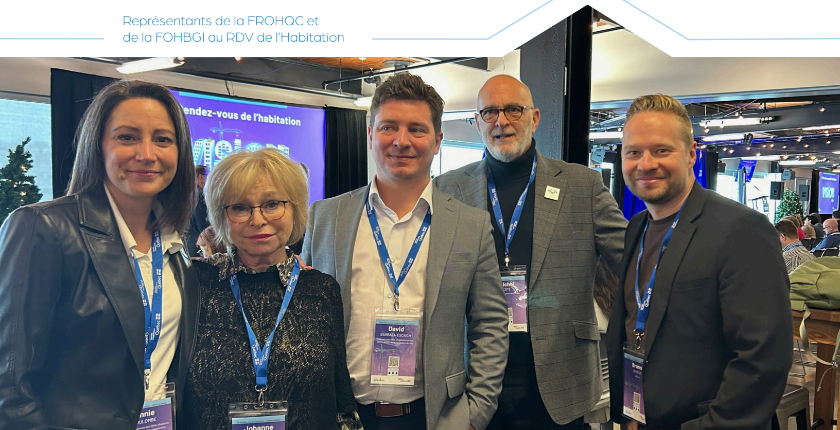
Représentants de la FROHQC et de la FOHBGI au RDV de l'Habitation

Suite à une entente avec la direction de la fédération de la Montérégie et l'Estrie (FROHME), les formations en ligne de la FROHME ont été offertes à nos membres et vice-versa. Une initiative bien appréciée par nos membres.