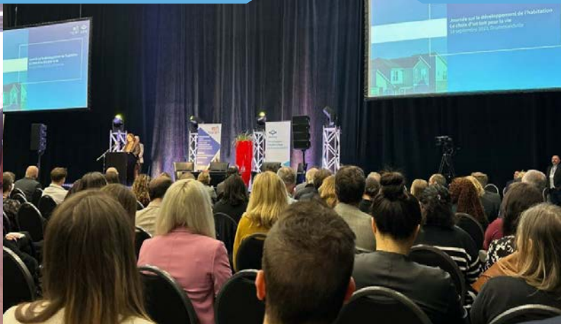
Journée de développement de l'habitation