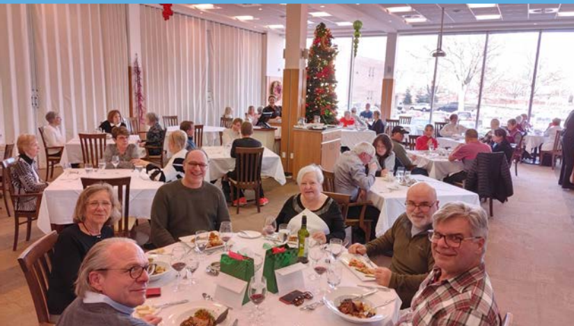
Bénévoles du projet radio