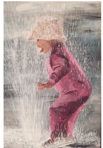
" MON BÉBÉ "