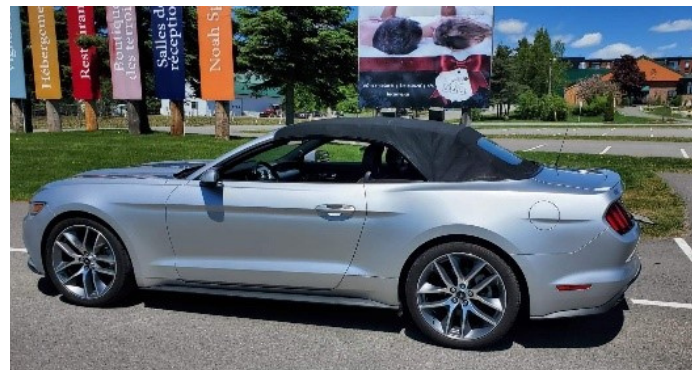
Mon rêve devenu réalité - ma Mustang

C'est un plaisir de travailler pour vous et d'être dans une bonne équipe.