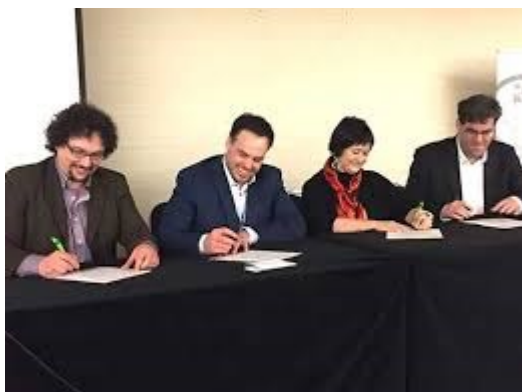
En avril 2018, les représentant.e.s des réseaux de l'habitation signent une déclaration pour demander un budget de 30 Millions de $ pour le soutien communautaire

Elle les informe que « Reconnaissant la nécessité du soutien communautaire en logement social et sociaux de répondre aux besoins de sa clientèle commune, la Société d'habitation du Québec (SHQ) et le ministère de la Santé et des Services Sociaux (MSSS) sont sensibles aux besoins de financement exprimés. » Des démarches sont engagées visant la réalisation d'une enquête sur les besoins en santé et services sociaux des bénéficiaires du parc de logements subventionnés et pour mettre à jour le Cadre de référence sur le soutien communautaire en logement social d'ici 2020.