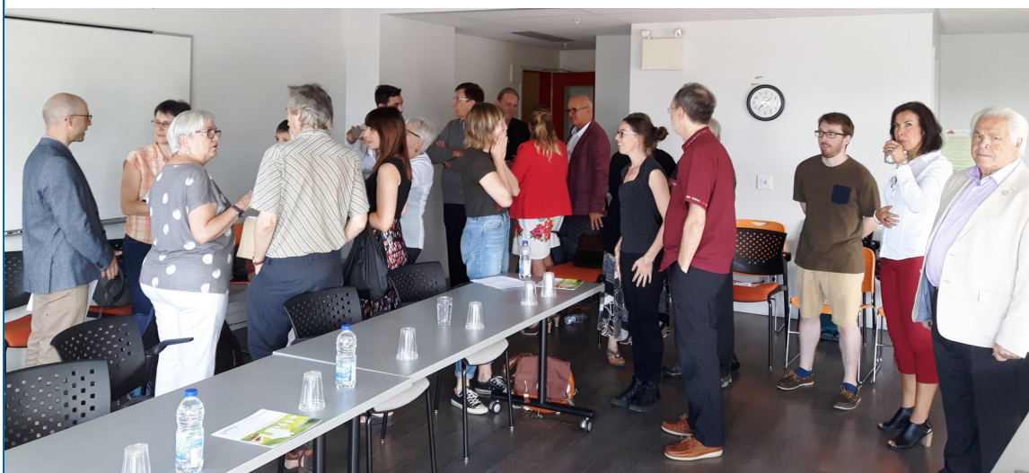
L'arrivée de la délégation de Québec Solidaire lors de la rencontre de la FROHQC le 6 septembre.

Le réinvestissement du gouvernement fédéral dans le logement social et communautaire est une excellente nouvelle. Les groupes espèrent qu'une entente avec le gouvernement du Québec permettra de bonifier la production de logements sociaux et communautaires à hauteur de 5 000 unités par an. Les normes environnementales imposées par le fédéral aux seuls groupes communautaires rendent l'utilisation des budgets plus difficiles.