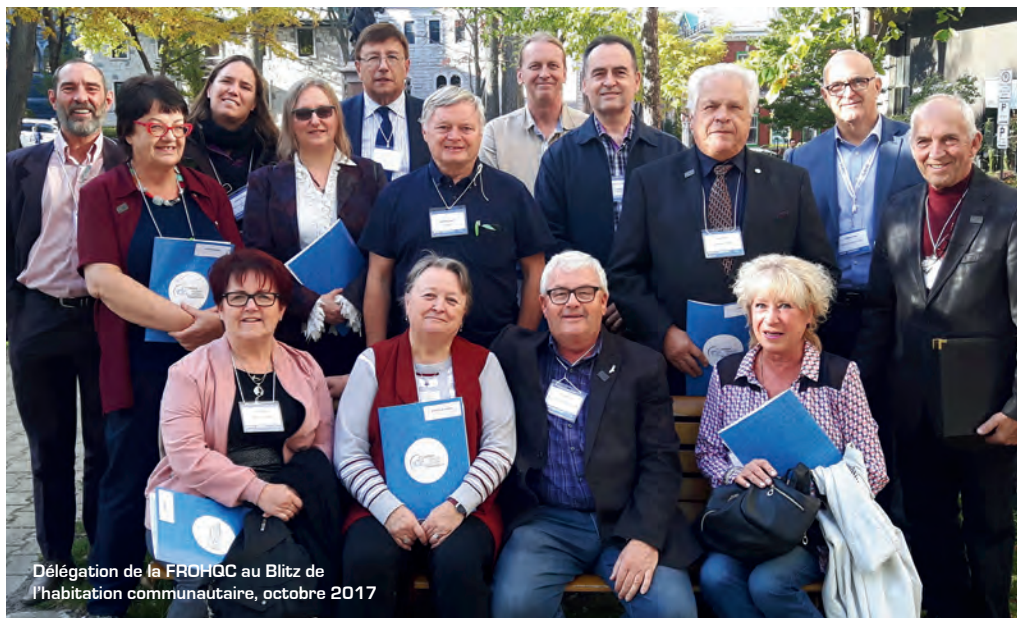
Délégation de la FROHQC au Blitz de l'habitation communautaire, octobre 2017

À ce titre, le Blitz du logement communautaire organisé à l'automne 2017 à Québec, a rencontré un franc succès. Pour sa seconde édition, il aura permis à des délégations composées de représentant.e.s de toutes les régions du Québec de rencontrer des députés et des autorités gouvernementales sur les grands dossiers : le développement et la pérennité du logement communautaire, le renforcement des partenaires, la sécurité des aînés et le crédit d'impôt pour le maintien à domicile, la lutte à l'itinérance, les droits des femmes et enfin le financement du soutien communautaire.