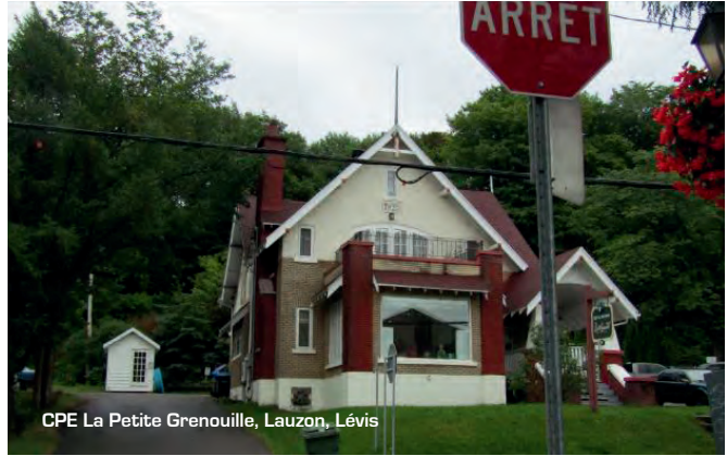
CPE La Petite Grenouille, Lauzon, Lévis

bases financières du centre de services et par le fait même de votre fédération.