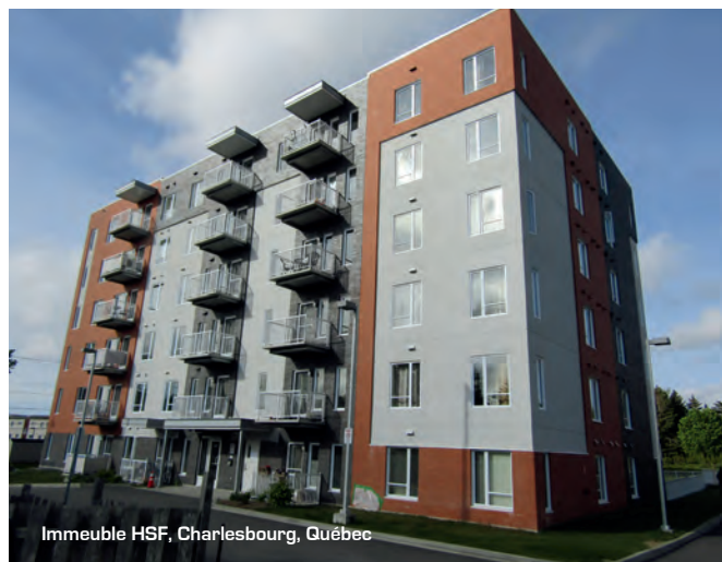
Immeuble HSF, Charlesbourg, Québec

En collaboration avec les RQOH ainsi qu'avec le centre de services de la FOHM (Montréal), le CSIEQ s'est vu octroyé le titre de "Fournisseur agréé" de la coopérative des centres de petite enfance William Coop. C'est donc dire qu'en 2017, votre centre de services a été sollicité par une douzaine de CPE de l'est du Québec pour y effectuer une inspection découlant en un bilan de santé. C'est une expansion des plus intéressantes pour votre fédération et permet d'obtenir davantage de revenus autonomes. La diversification des revenus permet de solidifier les