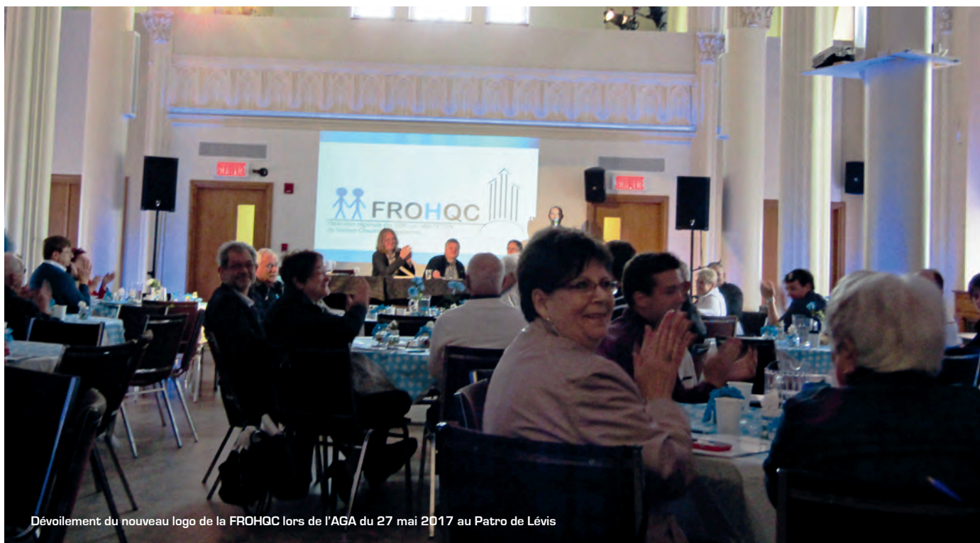
Dévoilement du nouveau logo de la FROHQC lors de l'AGA du 27 mai 2017 au Patro de Lévis