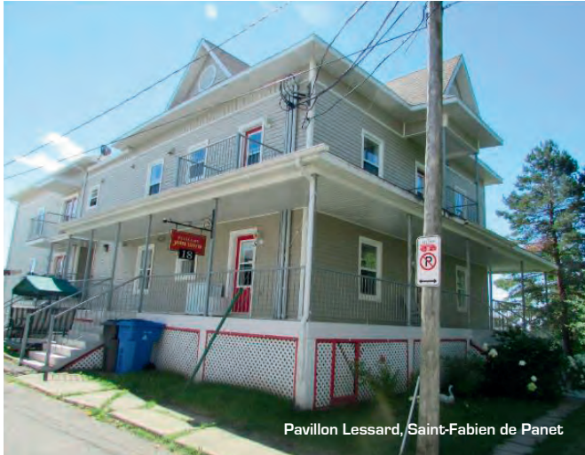
Pavillon Lessard, Saint-Fabien de Panet