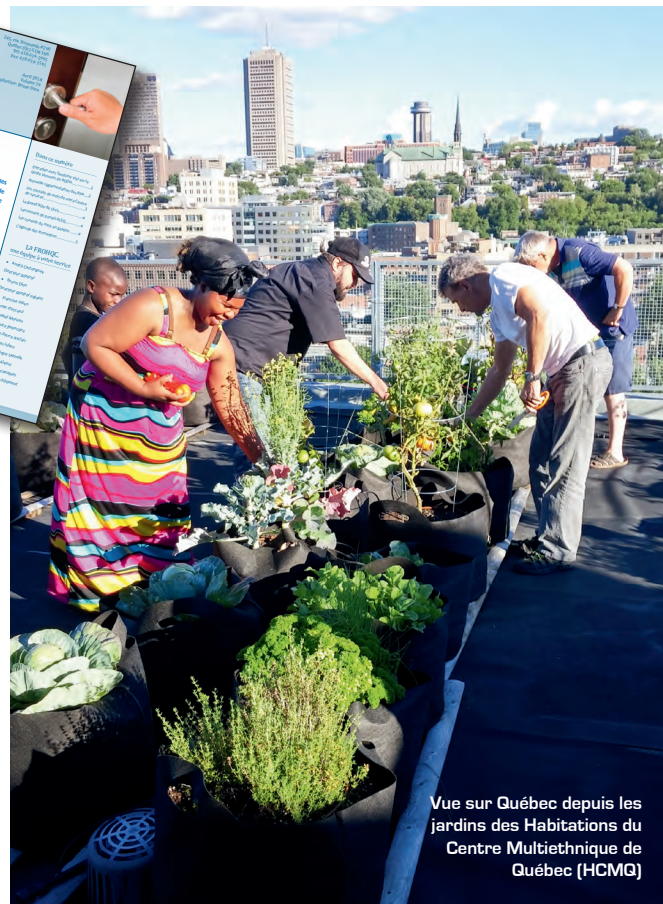
Vue sur Québec depuis les jardins des Habitations du Centre Multiethnique de Québec (HCMQ)