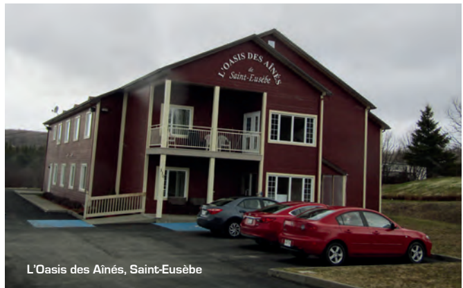
L'Oasis des Aînés, Saint-Eusèbe