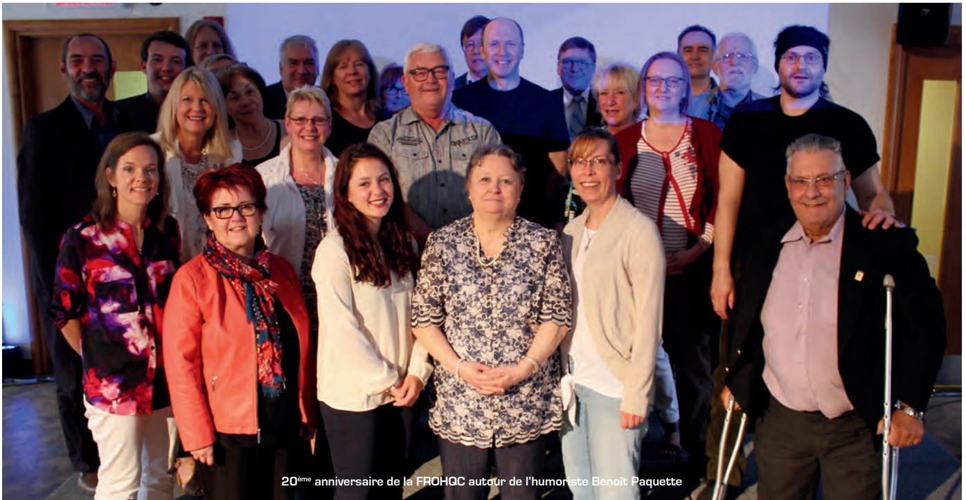
20 me anniversaire de la FROHQC autour de l'humoriste Benoit Paquette