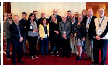
La délégation du Québec au colloque de l'ACHRU- Halifax, mai 2017