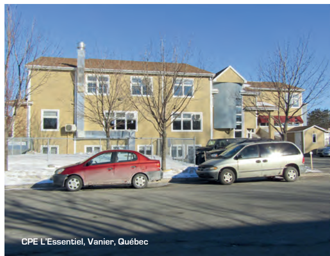
CPE L'Essentiel, Vanier, Québec

Plusieurs membres de notre fédération et des fédérations partenaires de l'Est du Québec ont également fait confiance aux inspecteurs du CSIEQ pour faire l'évaluation de leur bâtiment. Le rapport qui leur est rendu par la suite permet de vraiment connaître l'état de leur immeuble et permet aux administrateurs et gestionnaires de bien pla-