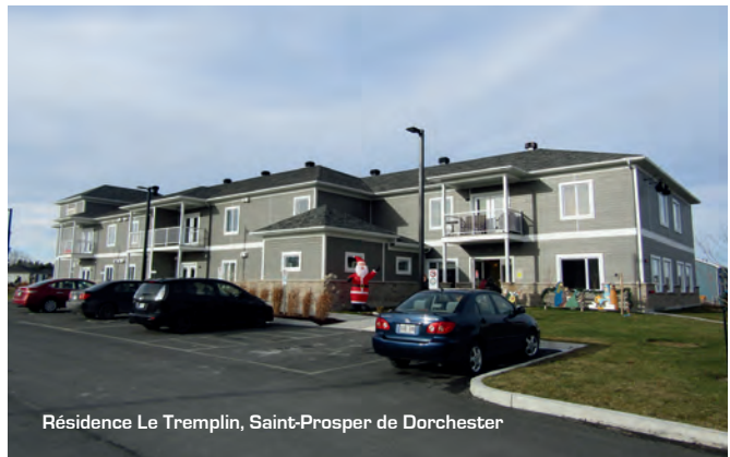
Résidence Le Tremplin, Saint-Prospere de Dorchester

Nous envisageons l'année 2018 avec un très grand optimisme. Un nouvel inspecteur a été embauché en 2017 et c'est avec une équipe élargie et une ressource déjà en place qui épaulera encore plus avant la direction dans le développement des affaires que l'on entreprend la solidification du centre de services ainsi que de la fédération.