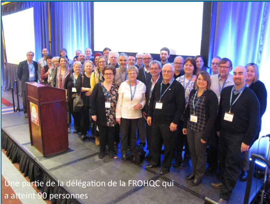
Une partie de la délégation de la FROHQC qui a atteint 90 personnes