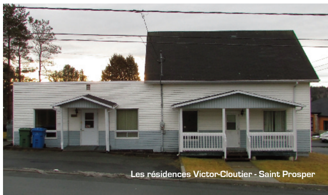
Les résidences Victor-Cloutier - Saint Prosper