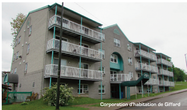
Corporation d'habitation de Giffard