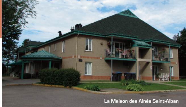
La Maison des Aînés Saint-Alban

Les bases sont donc jetées pour envisager un avenir plus que prometteur pour le Centre de Services Immobiliers de l'Est du Québec. Parlant d'avenir, la FROHQC et les fédérations partenaires s'entendront sur la façon de rendre plus neutres les services qui seront donnés aux membres des 4 fédérations. Cette entente prendra forme en 2017.