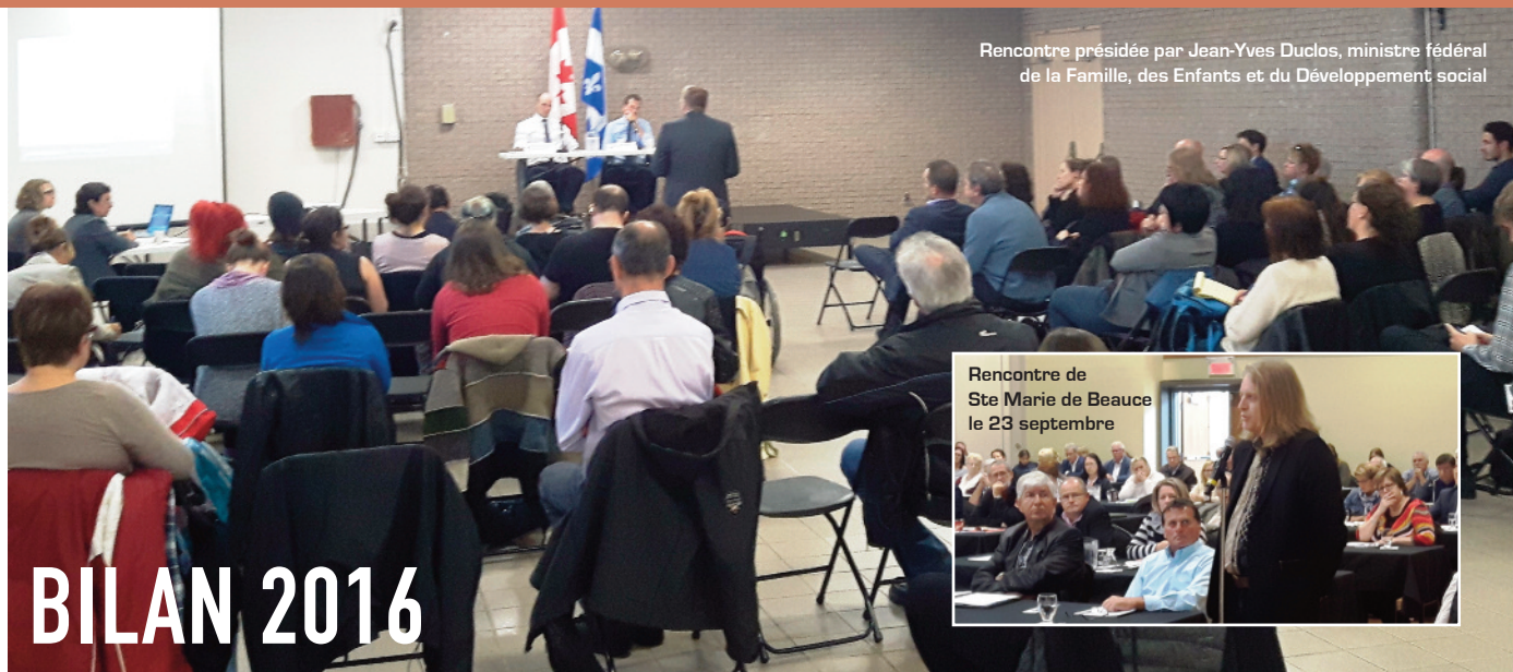
Rencontre présidée par Jean-Yves Duclos, ministre fédéral de la Famille, des Enfants et du Développement social