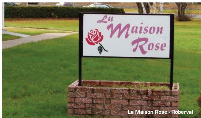
La Maison Rose - Roberval